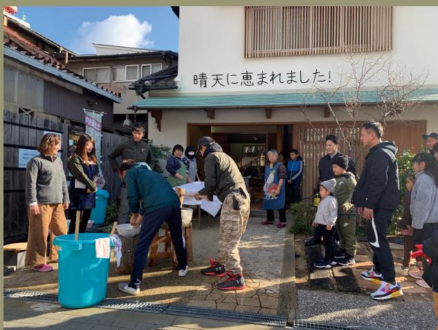
晴天に恵まれました!